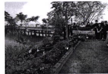
หมายเหตุ : แบบไฟล์ภาพหลักฐานเชิงประจักษ์ ๓-๕ ภาพ