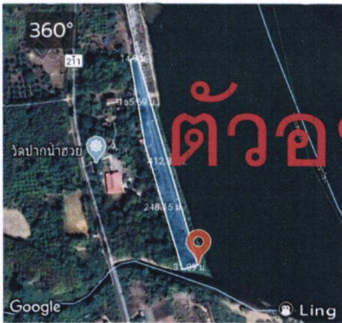
แปลงปลูกป่าน้ำฮวย