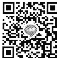
คิวอาร์โค้ดกลุ่มไลน์ “ศูนย์จัดการฯ ปี 63, 64”