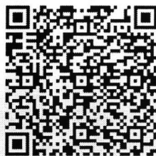
แบบรายงานกิจกรรมฯ (หลักฐานเชิงประจักษ์)

รายงานผ่านช่องทางไลน์กลุ่ม ชื่อ “ศูนย์จัดการฯ ปี ๖๓, ๖๔” โดยสแกนผ่านคิวอาร์โค้ด