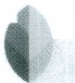
Snapseed Google LLC