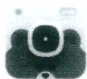
LINE Camera - by LINE Corporation