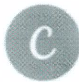
Canva - เครื่องมือ Canva