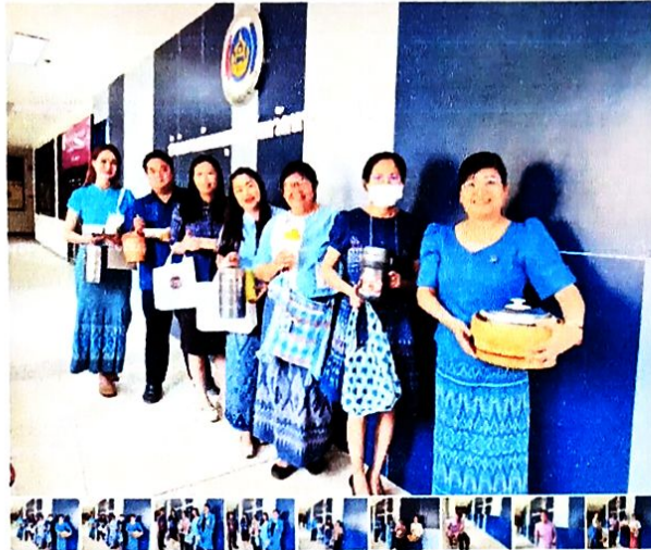
พช.ฉะเชิงเทรา นุ่งผ้าไทย หัวใจรักโลก 2565-01-1714