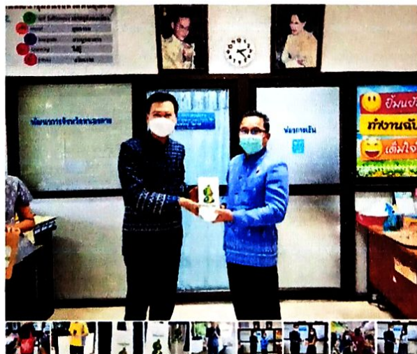
สำนักงานพัฒนาชุมชนจังหวัดฉะเชิงเทรา รมวงษ์การใส่ถุงผ้าและแก้วที่ทักวามเป็นมิตรการใส่ถุงผ้าพลาสติก 2565-01-1824