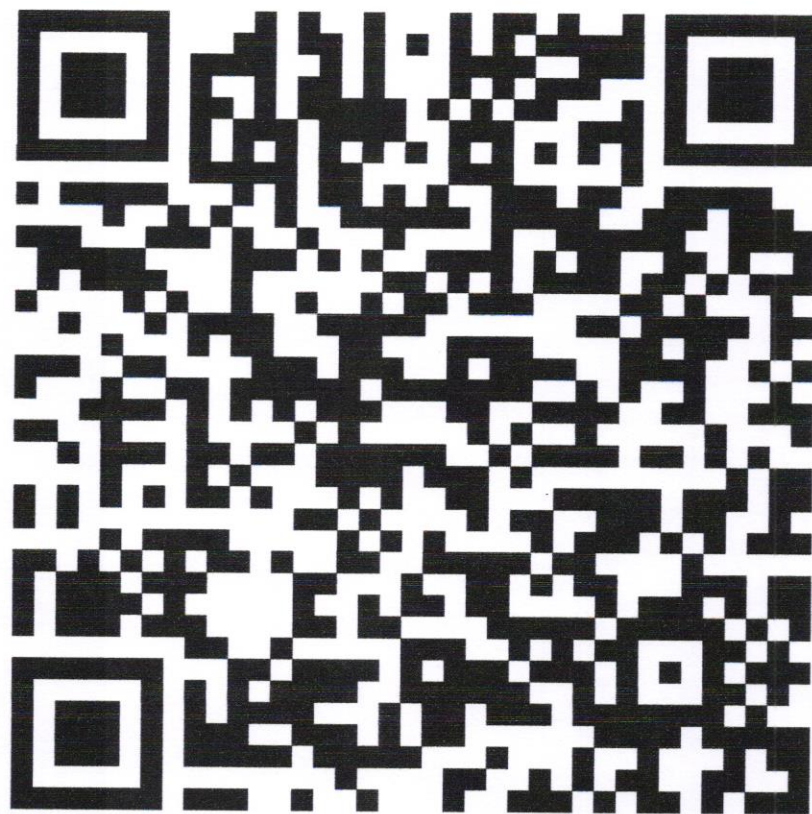
QR Code Google Drive อัปโหลดเอกสาร