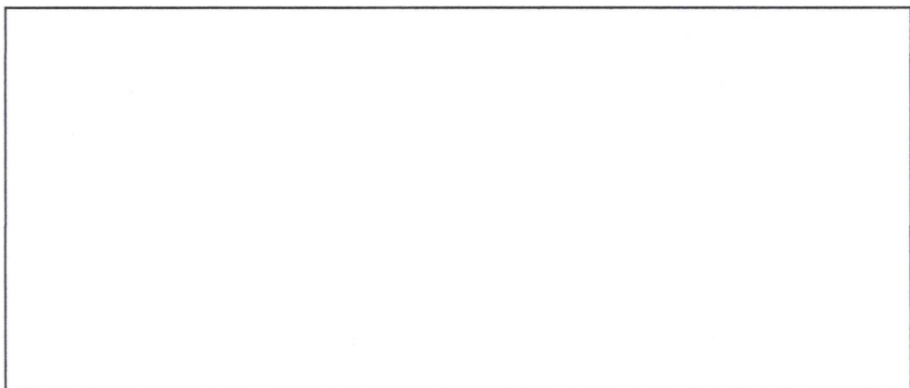
ภาพถ่ายกิจกรรม (คำบรรยายภาพถ่ายกิจกรรม)