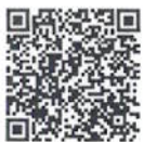
แบบรายงาน