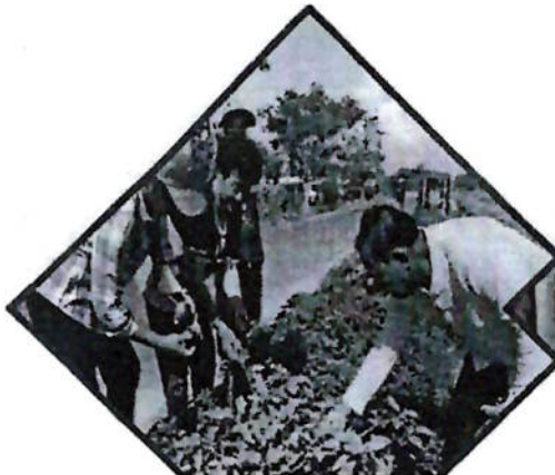
สร้างความมั่นคง