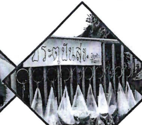
สร้างความมั่งคั่ง